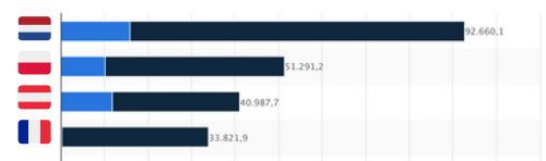
Importation de viande bovine en Allemagne selon les principaux pays d'origine en 2022(en tonnes)